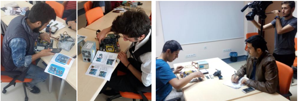
Şekil 3. Uygulama Süreci ve Fiziksel Test Fotoğrafları

Verilerin toplanmasında öğrencilere fiziksel test uygulanmıştır. Bu amaçla uygulamalı olarak öğrendikleri anakart montajını yapmaları sağlanmıştır. Anakart üzerine işlemci, RAM, sabit disk, ekran kartı, ethernet kartı ve güç kaynağı montajını yaparlarken video kaydı alınmıştır. Bu sırada araştırmacı, öğrencilerin montajı tamamlama sürelerini ve yaptıkları hata sayılarını not almıştır. Daha sonra videolar 1 konu alanı uzmanı eşliğinde analiz edilerek, öğrencilerin montajı tamamlama süreleri ve montaj sırasında yaptıkları hata sayıları net olarak tespit edilmiştir. Hata sayısı belirlenirken, aynı hatanın tekrar edilmesi durumunda, yeni hata sayısı olarak eklenmemiştir. Uygulama ve veri toplama sürecine ilişkin fotoğraflar Şekil 3'te verilmiştir.