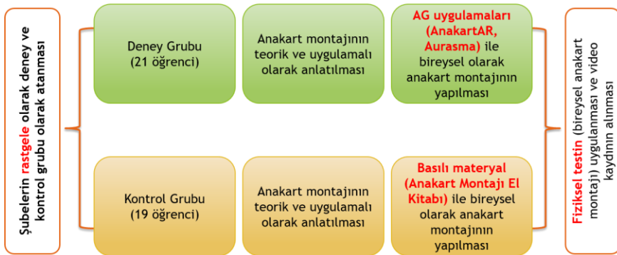
Şekil 1. Araştırma Süreci

Deney ve kontrol gruplarında süreç aynı adımlarla yürütülmüş sadece kullanılan öğretim materyali bakımından farklılık olmuştur. Öğrencilere anakart montajı hakkında gerekli teorik bilgiler verildikten sonra, montaj uygulamalı olarak araştırmacı tarafından gösterilmiştir (2 ders saati). Sonraki hafta öğrencilerin anakart montajını bireysel olarak tamamlamaları istenmiştir (2 ders saati). Anakart montajının tamamlanmasında kontrol grubundaki öğrenciler basılı materyalleri (Anakart Montajı El Kitabı) kullanırken, deney grubundaki öğrenciler ise AG uygulamalarını kaynak olarak kullanmışlardır. Araştırma süreci Şekil 1’de gösterilmiştir.